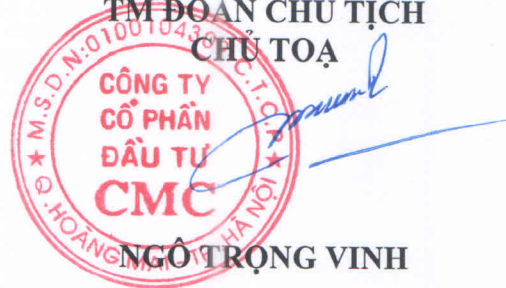
NGÔ TRỌNG VINH