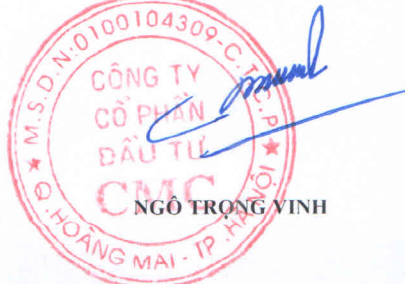
NGÔ TRỌNG VINH