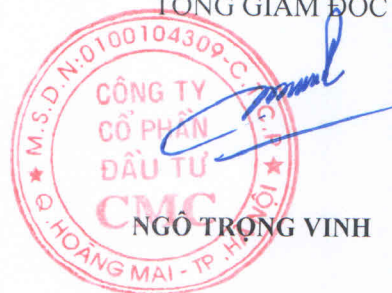
NGÔ TRỌNG VINH